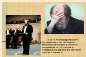
В 1978 Александр Исаевич Солженицын стал лауреатом Нобелевской премии и области литературы, но от поездки в Стокгольм на церемонию вручения премии отказался.

Датой, когда оборвалась трудная судьба великого писателя, стало 3 августа 2008 года. Солженицын умер в своем доме в Троице-Лыкове от сердечной недостаточности. Похоронили писателя в некрополе Донского монастыря.